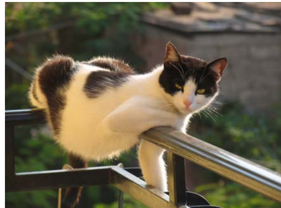
d' Mazza und